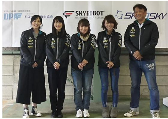
(左) ドローンスクールジャパン大阪豊中校 外観 (右) インストラクターをはじめとして女性が多数活躍