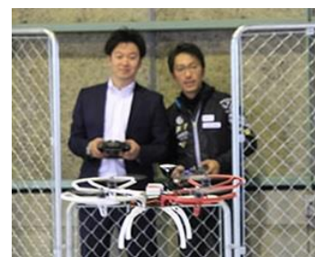
初めてでも安心の操縦体験

メディアの方のドローン操縦体験や、ご取材も受け付けています。 お申し込みは、スカイロボット広報事務局までお願いいたします。