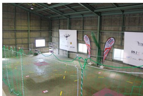
西日本初の屋内飛行訓練所

お客様からのお問い合わせ先 電話 06-6857-2631（ドローンスクールジャパン大阪豊中校）