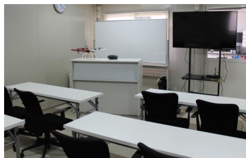
操縦モラルや飛行許可申請のノウハウも身につく