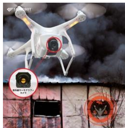
火災現場での捜索活動（イメージ）

『スカイボランティア』は、有志のドローン操縦士に登録してもらい、非常時には警察・消防・自治体と連携し、救助支援や被害調査に関する活動を行なってもらうためのネットワークです。火災や大規模災害の発生時の救助支援だけでなく、登山者の遭難救助、老人や幼児などの行方不明者発見のために活動することを想定しています。認知症による徘徊、誘拐、水難事故、自然災害など理由は様々ですが、2015年の警察庁の発表によると、日本では届出のあった数だけでも年間 8.2 万人が行方不明となっています。その大半は発見されているものの、年間約 2 千人は行方不明のままです。行方不明者は、警察や消防、自治体が捜索にあたりますが、多大な時間と労力を要するため、人手が足りない状況です。人の入れない場所や、夜間も捜索にあたることのできるドローンで、各地域の操縦士が効率的かつ安全な人命救助を目指します。