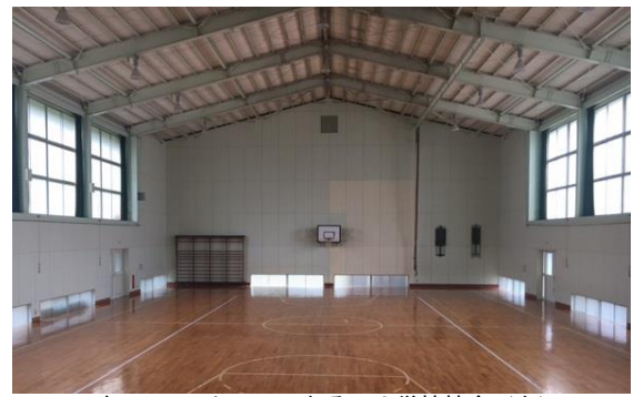
ドローンスクールになる旧小学校校舎（左） 広い体育館で天候に関係なく訓練できる（右）